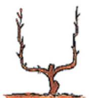
Palmette en U simple

La première taille que l'olivier subit a pour but de lui donner une forme. Celle préconisée traditionnellement est le « gobelet ». Elle permet d'obtenir un arbre équilibré, au houppier aéré et de dimension modeste, facilitant l'accès pour la cueillette et les éventuels traitements. Sachez qu'un sol bien nourri permet un bon renforcement de la plante et ainsi de limiter les traitements. Les premières années, les pousses qui se développent sur la tige principale sont supprimées afin de former le tronc. Puis, lorsque l'arbre arrive à sa 4e année (environ 1,50 m de haut), le rameau central est supprimé et les branches charpentières (quatre ou cinq) sélectionnées, afin de former le gobelet.