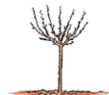
Tige avec tête en gobelet